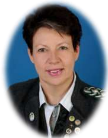
1. Schützenmeisterin Schützengesellschaft Die Denninger e.V.

In der Hoffnung auf ein schönes und unfallfreies Gauschießen, wünsche ich uns Schützen, und den Gästen einen wunderbaren Schießwettbewerb.